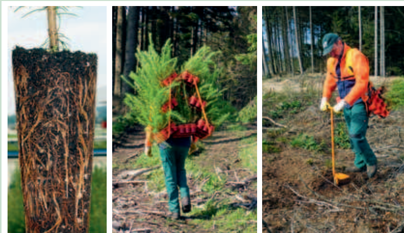
sehr gute Wurzelentwicklung